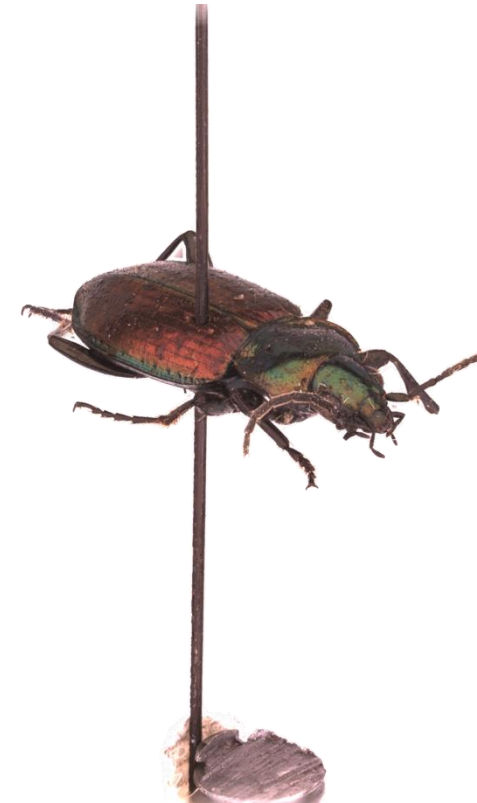
Sechspunkt Glanzflachläufer Agonum sexpunctatum