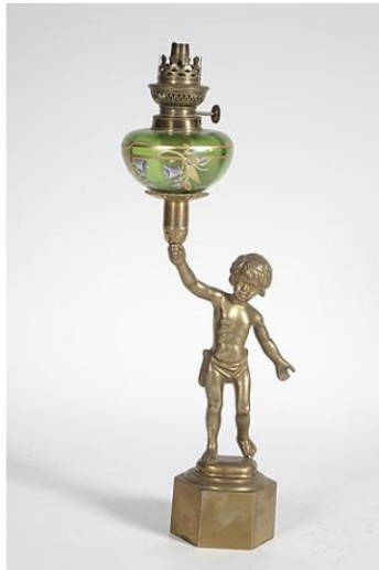
Figurenlampe, Junge hält Lampe

Klicke auf das Element, welches doppelt vorkam