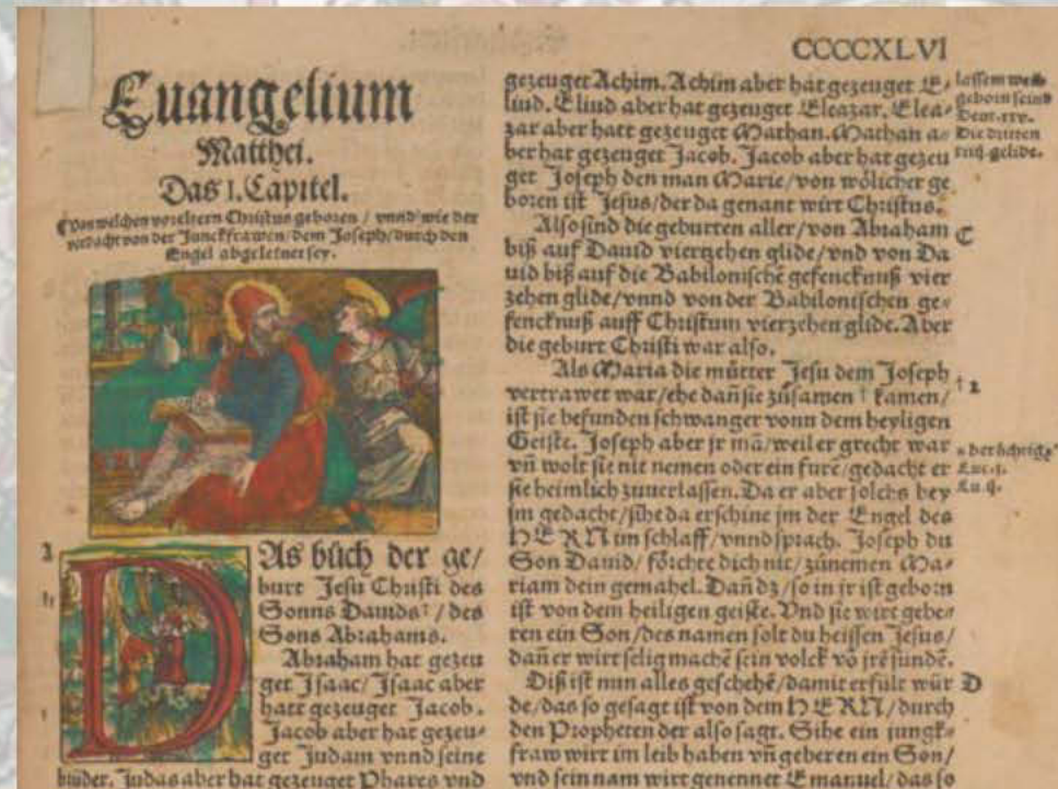
Dietsingerbibel 1534, Stich Anton Woensam