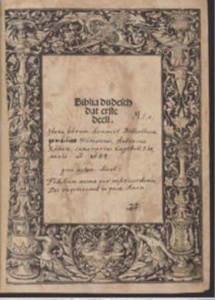
Vorlutherische deutsche Bibeln