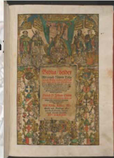
Katholische Gegenbibeln (Erstausgaben)