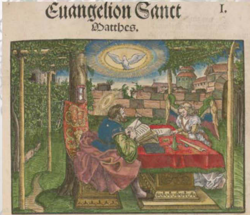
Lutherbibel 1534, Stich Lucas Cranach