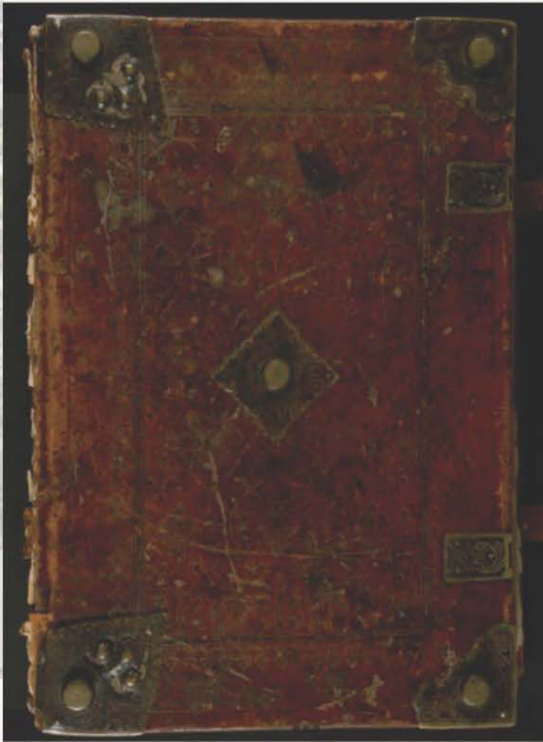
Koberger Bibel 1483