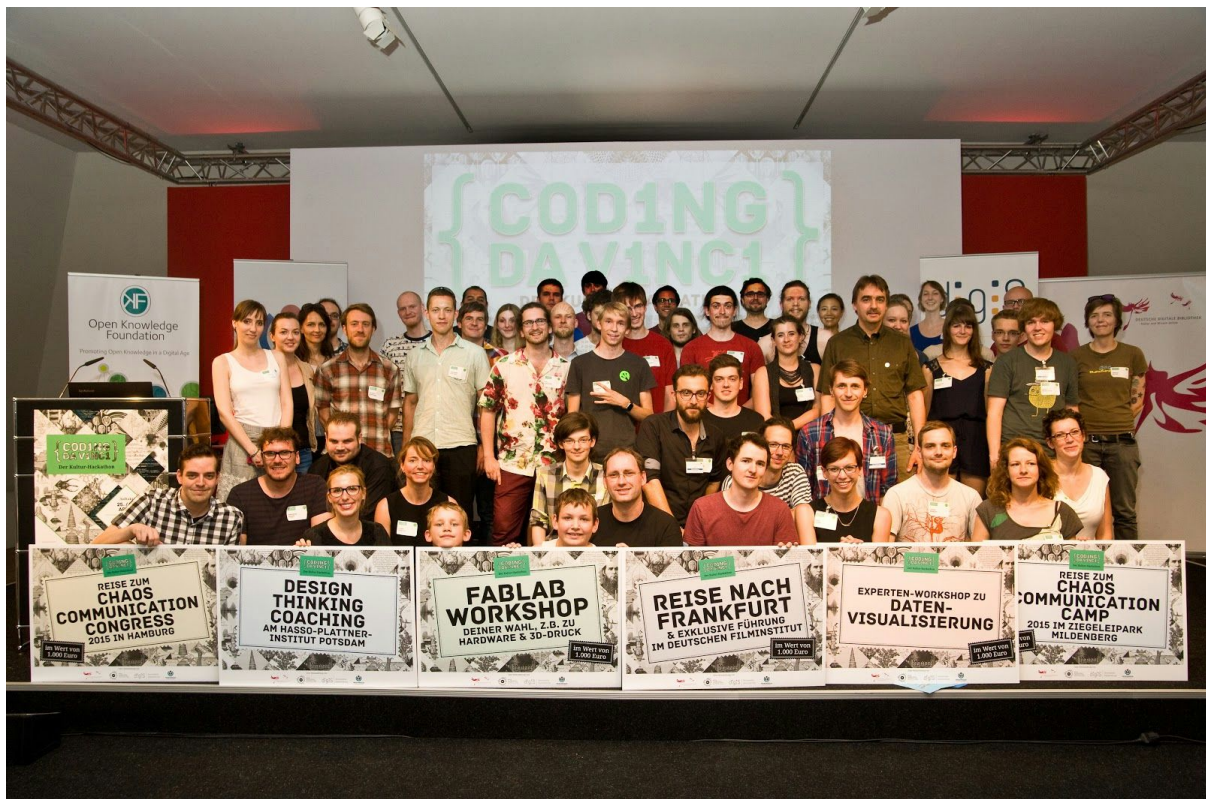
Bild: Teilnehmer/innen und Gewinner von Coding da Vinci 2015

Auch im zweiten Jahr von Coding da Vinci wurden wir überrascht: Die Diversität der von 33 Kulturinstitutionen bereitgestellten offenen Kulturdatensätze inspirierte die 150 Teilnehmenden der Auftaktveranstaltung zu 28 Projektideen!