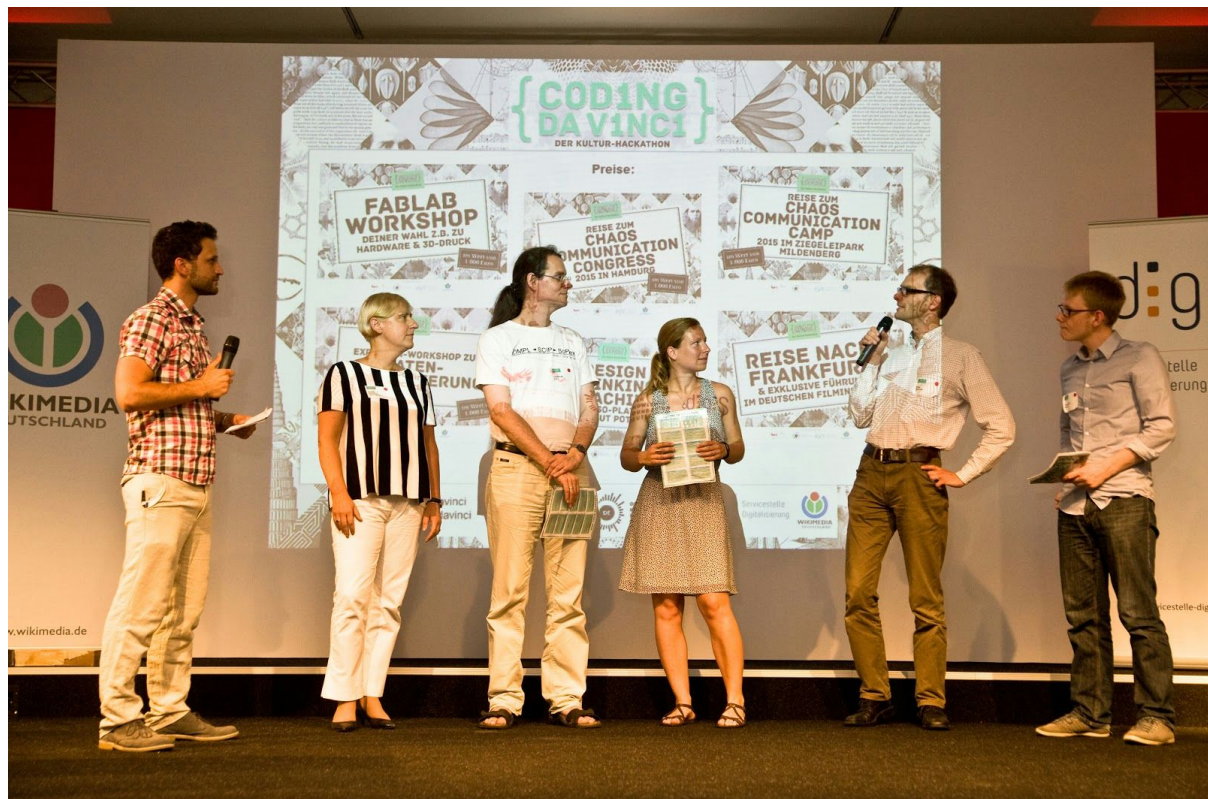
Bild: Jury verkündet die Gewinner

Und das sind die 6 Gewinner: Herzlichen Glückwunsch !!