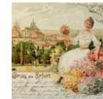
Postcards from World War I