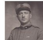
World War I Italian Front