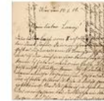
Letters from World War I