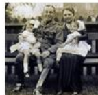
World War I Home front