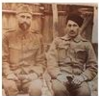
World War I Eastern front