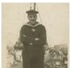
World War I Naval warfare