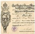
Official documents from World War I