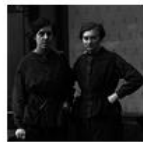
Women in World War I