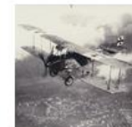
World War I Aerial warfare