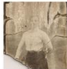
Photographs from World War I